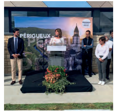
Inauguration du gymnase Clos Chassaing

Le Département a mis en place des aides directes pour les jeunes : la bourse départementale pour les collégiens, la prime d'apprentissage, la bourse de séjour en colonie de vacances, la bourse ERASMUS pour les étudiants voulant faire une partie de leurs études dans une université de l'Union Européenne et la bourse de 3ème cycle pour les étudiants doctorants. Nous avons aussi créé des prêts d'honneur à taux zéro afin de faciliter aux jeunes périgourdins modestes la poursuite d'études dans des établissements d'enseignement supérieur de l'Etat ou reconnus par ce dernier.