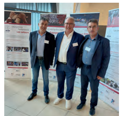
Conférence Régionale du Sport de Nouvelle Aquitaine