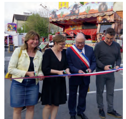
Fêtes de Saint Georges