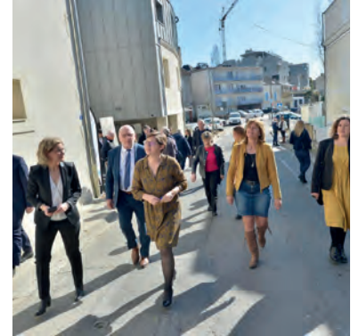
Inauguration des résidences HLM à Périgueux