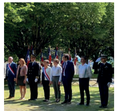
Cérémonie du 8 mai 1945